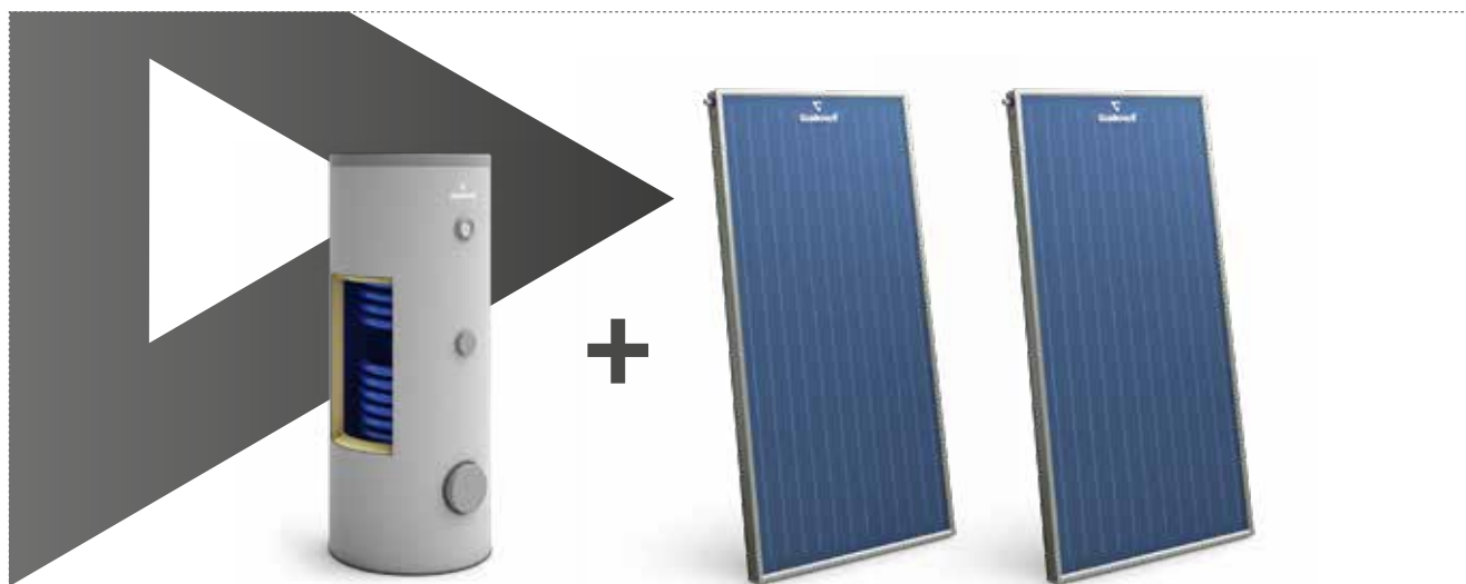
SGW(S)B Tower Biwal, бивалентный водонагреватель для ГВС на 200 л