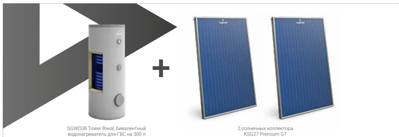
SGW(S)B Tower Biwal, бивалентный водонагреватель для ГВС на 300 л